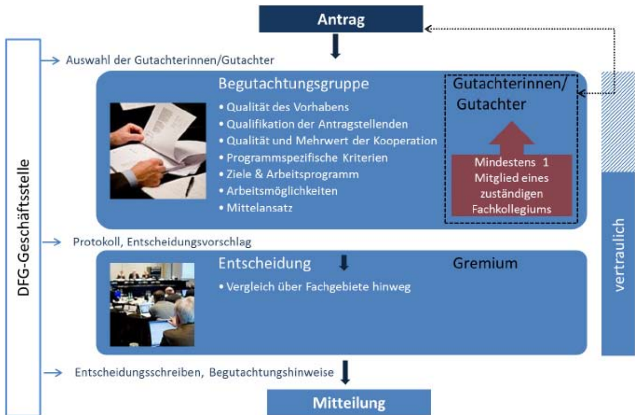
Abb. 5: Übersicht zu den übergeordneten Entscheidungsprozessen in den koordinierten Förderverfahren, hier sind die Fachkollegien in den Begutachtungsprozess eingebunden.

Die Sitzungsvor- und -nachbereitungen erfolgen auch hier durch die Geschäftsstelle. Ebenso werden die Unterlagen elektronisch über das elan-Portal bereitgestellt.