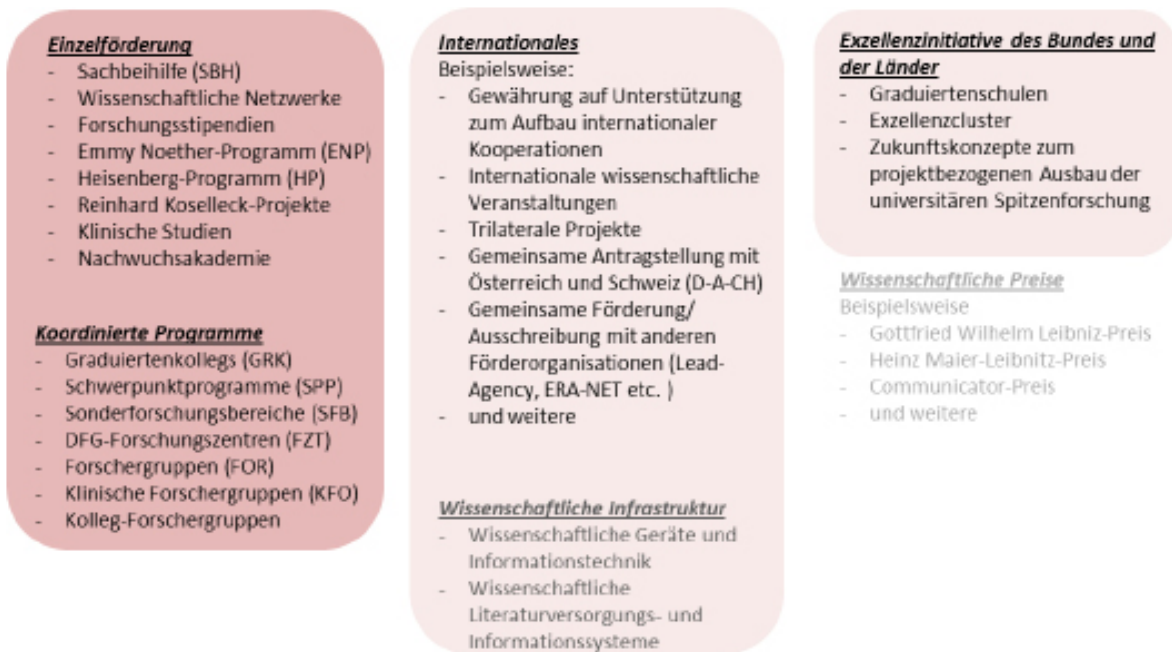
Abb. 2: Das Förderprogramm-Portfolio der DFG. In den Arbeitsbereich der Fachkollegien fallen vor allem Anträge aus der „Einzelförderung“ und den „Koordinierten Programmen“, in den Bereichen „Internationales“, „Wissenschaftliche Infrastruktur“ und „Exzellenzinitiative“ sind sie beteiligt (Quelle: www.dfg.de/foerderung/antragstellung/programme_und_module ).